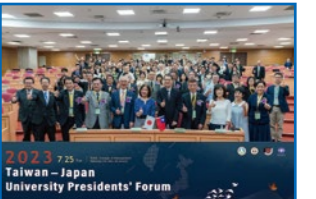
日台交流事業「2023 Taiwan-Japan University Presidents' Forum」を開催