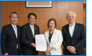
永岡文部科学大臣(当時)に要望書を提出