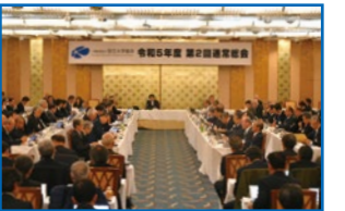
第2回通常総会を開催