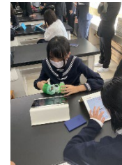
理科の事例 大学院生がファシリテートする