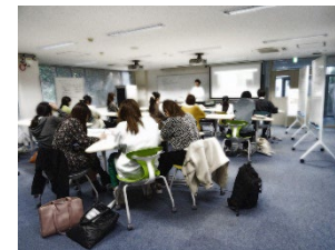
国語の事例 中学生、学部生、大学院生が学びあう