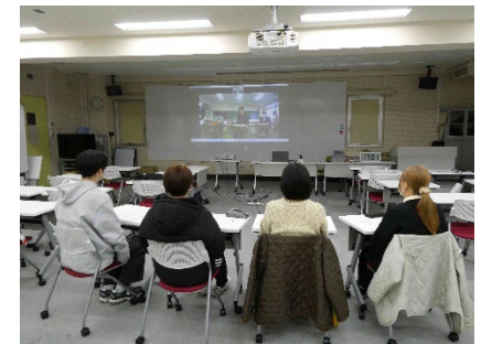
高校生と大学生のオンライン交流会