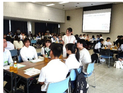
高校生大学体験入学での模擬授業